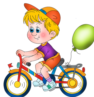
Фото носит иллюстрационный характер